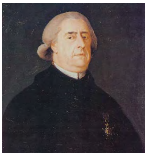
Ilmo Ramón de Pignatelli